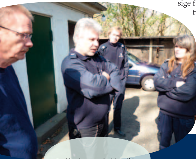
Parkbetjentene holder til i en lille hvid bygning over for Rigshospitalet. Her et billede fra gården.

Så parkbetjentene passer stadig godt på København, københavnere og byens besøgende.